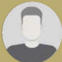
איתן כבל חבר הכנסת לשעבר