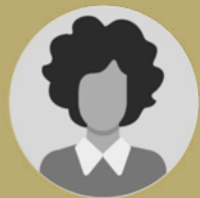
פרופ' נדין בודו-טרכטנברג, המשנה לנגיד בנק ישראל