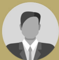
פרופ' חיים אסייג