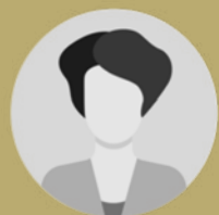
פרופ' קרנית פלוג נגידת בנק ישראל לשעבר